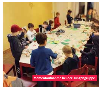
Momentaufnahme bei der Jungengruppe

Familiensonntag (ab 03.03.2024) CVJM Außengelände