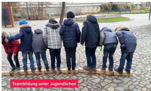
Teambuilding unter Jugendlichen