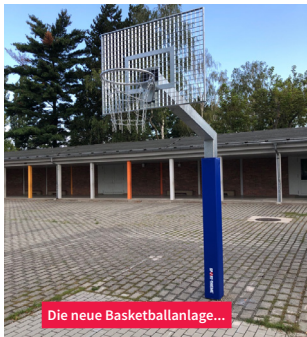
Die neue Basketballanlage...

Da haben die Kinder der Hans-Christian-Andersen-Grundschule Augen gemacht: