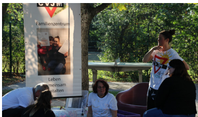
Familienzentrum auf der Sponsorenallye 2019

Zukünftig sollen weitere Angebote im Familienzentrum für (Groß-)Eltern und ihre (Enkel-)Kinder entstehen. Haben sie Ideen oder Wünsche zu neuen Angeboten, kommen Sie gerne auf uns zu.