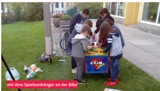
mit dem Spieleanhänger an der Bibi